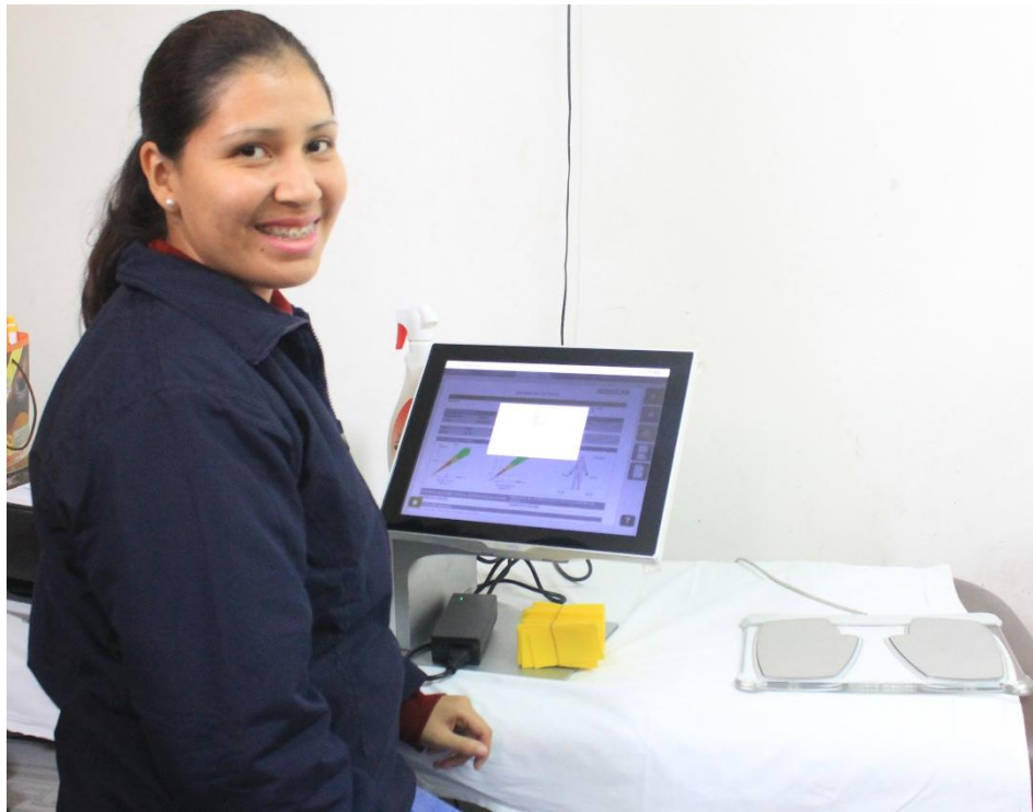
La representante del Laboratorio ofreció participar en una próxima campaña con el importante equipo digital